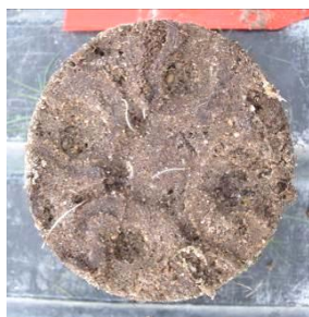
Témoin non traité

Effet de Bacillus R6CDX , sur la croissance racinaire Research center, Julius Kühn Institute, Münster 2011