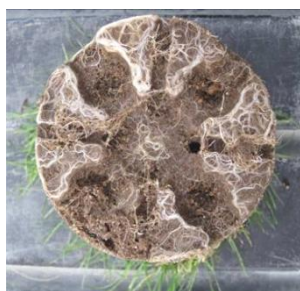
Bacillus R6-CDX (Vitanica® RZ Bio)

Fiche de données de sécurité disponible sur : www.quickfds.com